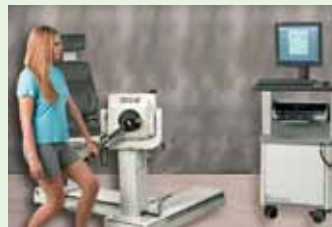
Mano e simulatore del lavoro