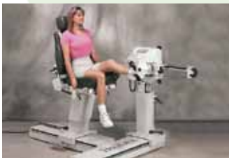
Catena cinetica chiusa