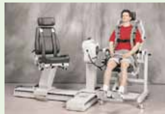
Riabilitatore della schiena